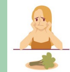
Diminution voire perte du goût ou de l'odorat

La surveillance de ces symptômes doit être rapprochée si vous avez connaissance de cas avérés ou suspects de l'être dans votre entourage.