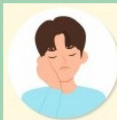
Diarrhée dans les dernières 24H